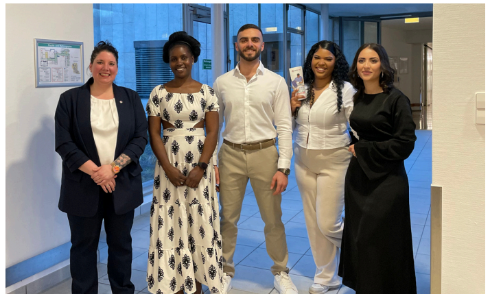
GRUPPENFOTO BEI DER EXAMENSFEIER AM KVSW