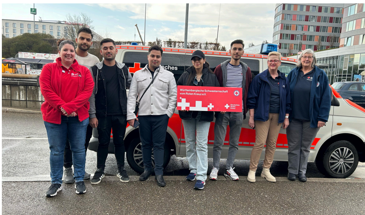
DER DRK-KREISVERBAND GÖPPINGEN UNTERSTÜTZTE BEI DER ABHOLUNG UNSERER AUSZUBILDENDEN UND BEGLEITETE SIE IN IHRE NEUEN WOHNUNGEN

Wir wünschen den Auszubildenden ein gutes Ankommen und einen guten Start in die Ausbildung bei der Württembergischen Schwesternschaft. Das Begleitvideo können Sie sich hier anschauen.