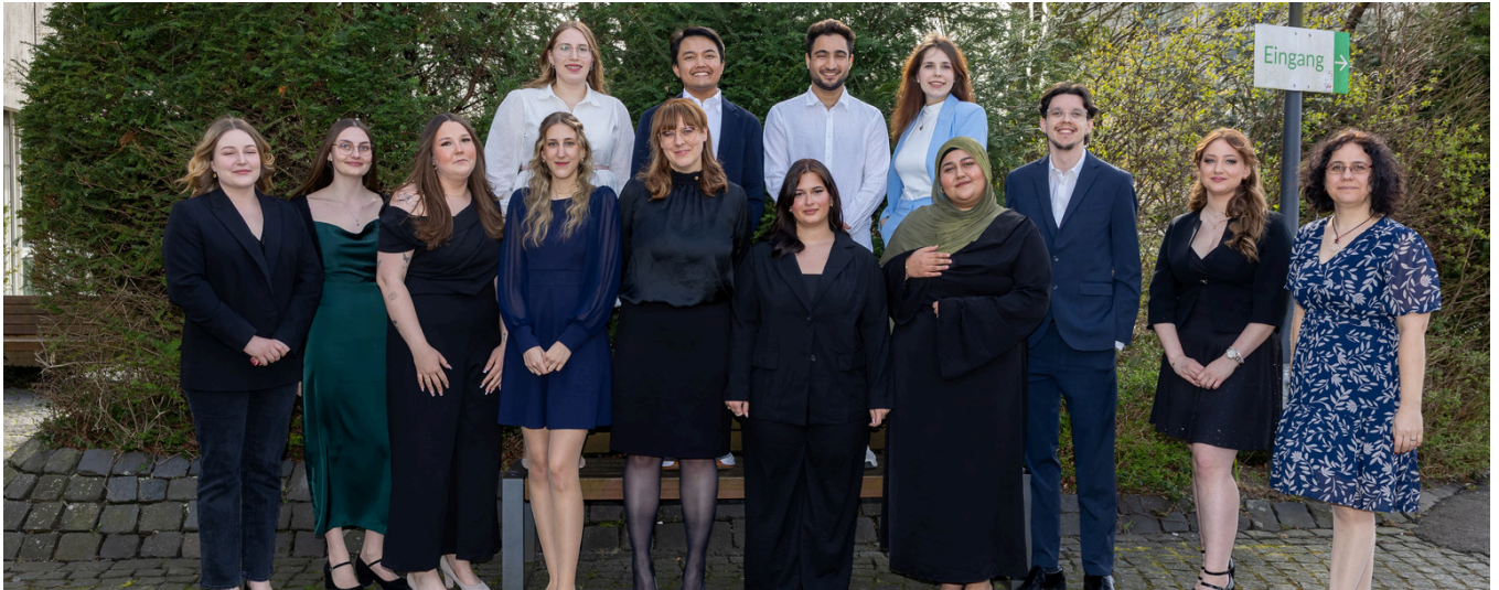
GRUPPENFOTO BEI DER EXAMENSFEIER DER ALBFILSKLINIKEN