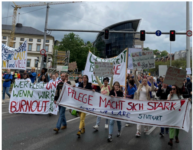
DER DEMOZUG AM TAG DER PFLEGENDE 2023

Alle, die sich für eine starke Pflege einsetzen, sind eingeladen, mitzulaufen und Haltung zu zeigen!