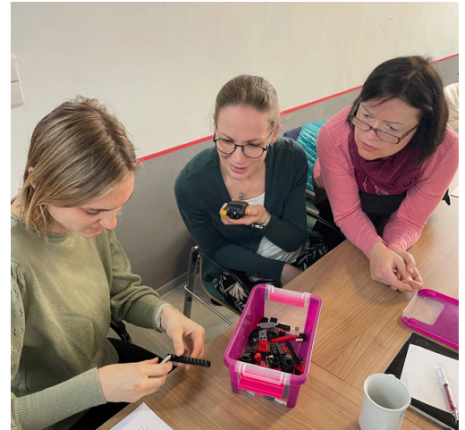
PRAKTISCHE ÜBUNGEN WIE DIE KOMMUNIKATION ÜBER DAS FUNKGERÄT SIND TEIL DER BASISSCHULUNG