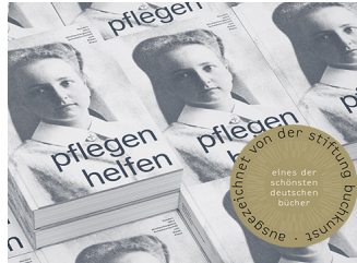
Buch „pflegen helfen“ weiter auf Erfolgskurs