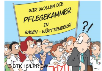
Neues von der Landes- pflegekammer